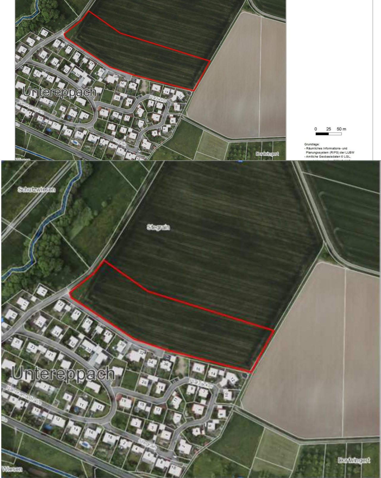
Abb.2: Lage und Abgrenzung des Planungsgebietes (Grundlage: LUBW KARTENDIENST)