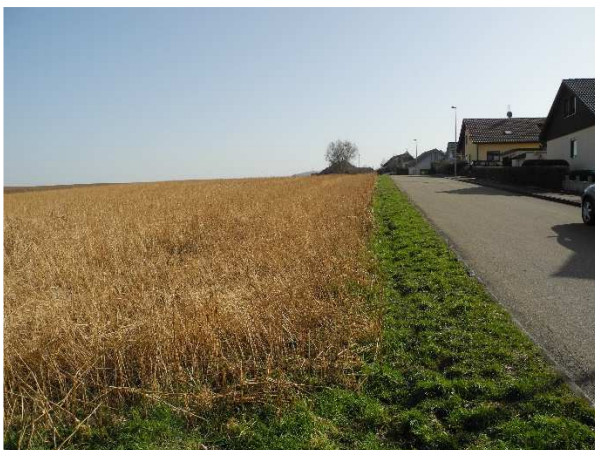
Abbildung 5: Planungsraum schließt sich der bestehenden Wohnbebauung an

Der Hang wird von einer weit überschaubaren, eintönigen Ackerfläche eingenommen, auf der Gehölze oder andere landschaftsbildprägende Elemente weitgehend fehlen. Sowohl im Westen als auch im