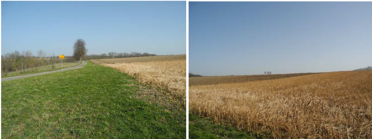
Abbildung 4: Blick in Richtung Norden (Bild 1), Blick in Richtung Osten (Bild 2)

Das Plangebiet liegt an einem von Süd-Ost nach Nord-West leicht abfallenden Hang, der sich der bestehenden Wohnbebauung anschließt.