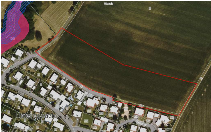
Abbildung 3: Der Planungsraum wird v.a. von Ackerflächen eingenommen. (Blaue Schraffur - FFH-Gebiet, rote Fläche - Biotope nach §32 NatSchG)

Die faunistischen Verhältnisse wurden im Zuge der Untersuchungen B-Plan „Stegrain“ in Neuenstein-Untereppach, Relevanzprüfung zum Artenschutz 6 und B-Plan „Stegrain“ in Neuenstein-Untereppach, Faunistische Untersuchung unter Berücksichtigung des speziellen Artenschutzes 7 ermittelt und bewertet. Die Ergebnisse werden nachfolgend zusammengefasst dargestellt.