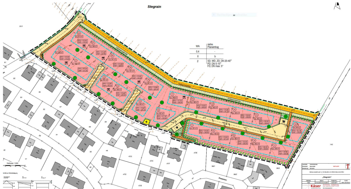
Abbildung 2: Bebauungsplan gem. §13b BauGB und örtliche Bauvorschriften (ohne Maßstab, Käser Ingenieure 15.10.20)

Das ca. 156 Ar große Plangebiet im Nordosten von Untereppach schließt sich im Süden der bestehenden Bebauung an.