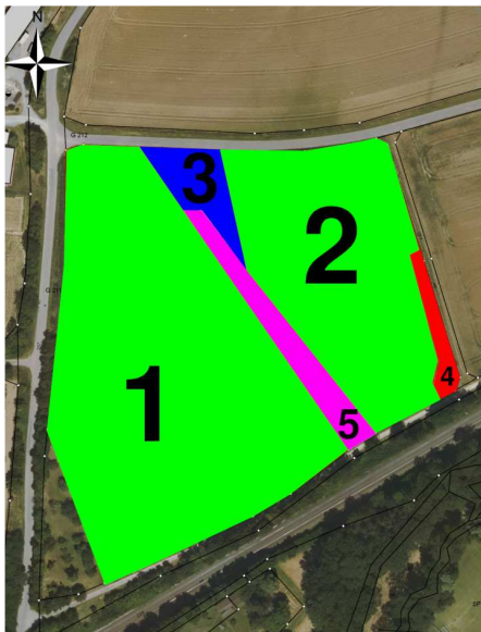
Abbildung 7: CEF-Maßnahme Lage der Blühfläche (blauer Bereich Nr.3), Nr.1 und 2 Ackerfläche mit unterschiedlichen Ackerkulturen, 4 Graben, 5 naturnahes Landschaftselement

Die Maßnahme ist im zeitlichen Vorgriff des Vorhabens umzusetzen und dauerhaft zu sichern.