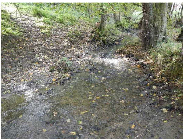
Abbildung 6: Der Epbach im Bereich der Einmündung der geplanten offenen Mulde zur Ableitung des anfallenden Oberflächenwassers

Der Planungsraum liegt ca. 100 m vom FFH-Gebiet FFH 6723311 - Ohrn-, Kupfer- und Forellental entfernt, das als schmales Band dem Verlauf des Epbachs folgt. Das FFH-Gebiet setzt sich bachabwärts entlang der Gewässer fort und bildet ein weit verzweigtes Netz u.a. naturnaher Fließgewässerabschnitte von Ohrn, Sall, Kupfer, Forellenbach und Bibers. Für das FFH-Gebiet liegt ein Managementplan vor 15 .