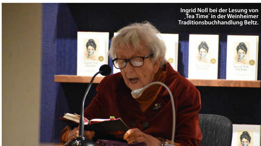
Ingrid Noll bei der Lesung von „Tea Time“ in der Weinheimer Traditionsbuchhandlung Beltz.