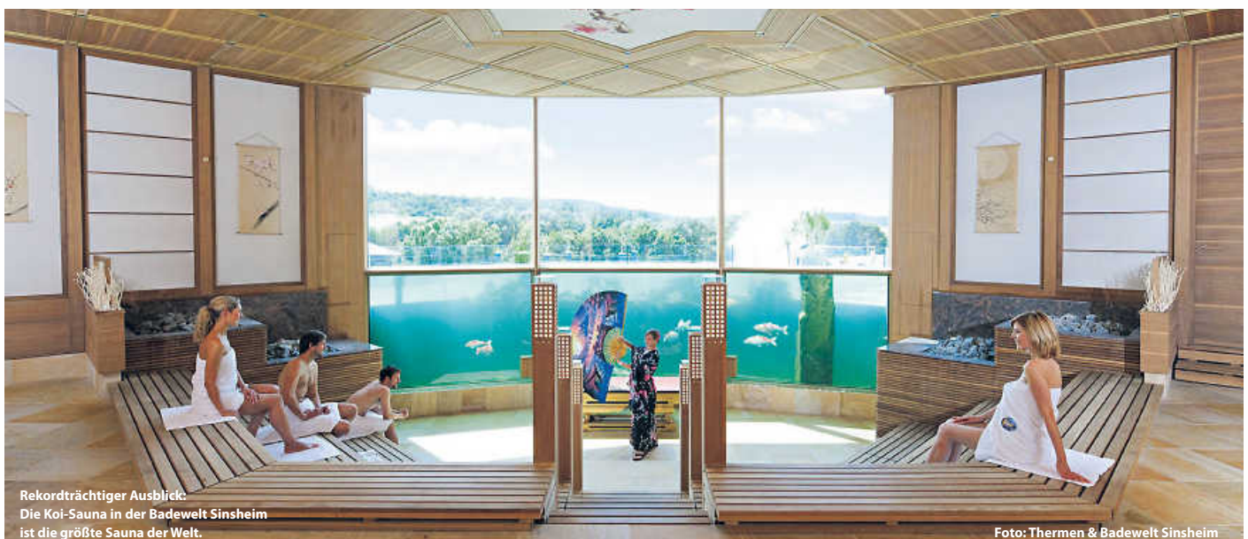
Rekordträchtiger Ausblick: Die Koi-Sauna in der Badewelt Sinsheim ist die größte Sauna der Welt.