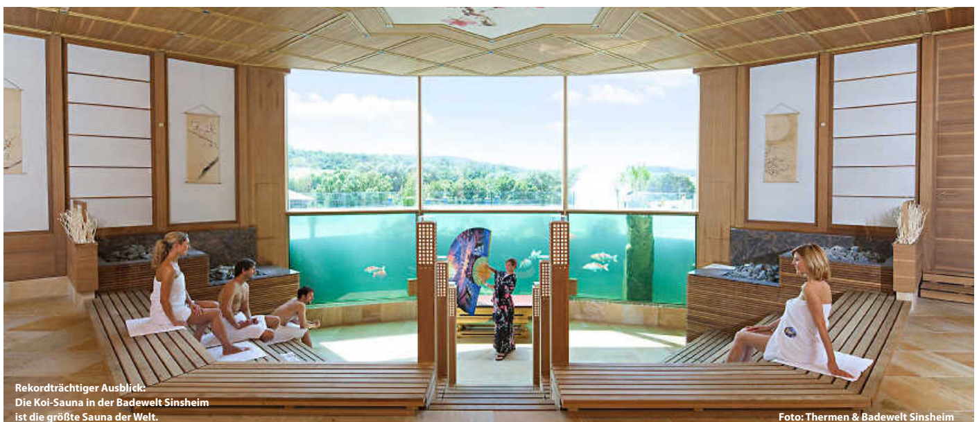
Rekordträchtiger Ausblick: Die Koi-Sauna in der Badewelt Sinsheim ist die größte Sauna der Welt.