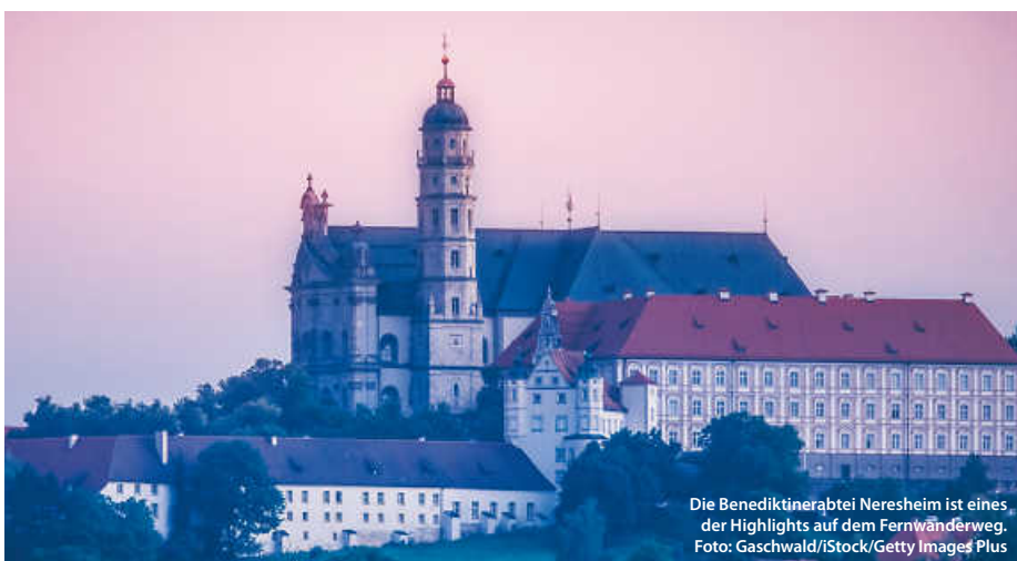
Die Benediktinerabtei Neresheim ist eines der Highlights auf dem Fernwanderweg.

Und natürlich warten überall Schafe: Heute noch bewirtschaftete Schafhöfe, uralte Schaftriebe, die Kultur des Schäferlaufes – sie alle geben spannende Einblicke in die Kultur der Schäfer, die die Region bis heute einzigartig und vor Ort erlebbar machen. (haf/jr)