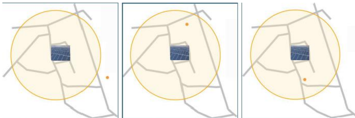
Abb. 2: Der Immissionsort liegt weiter als ca. 100 m von der Photovoltaikanlage entfernt.

Immissionsorte, die vorwiegend südlich von einer Photovoltaikanlage gelegen sind, brauchen nur bei Photovoltaik-Fassaden (senkrecht angeordnete Photovoltaikmodule) berücksichtigt zu werden.