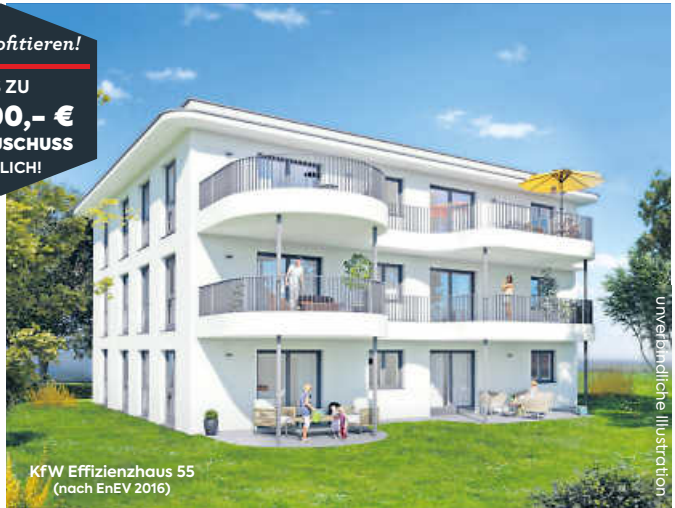
KfW Effizienzhaus 55 (nach EnEV 2016)

Jetzt profitieren! BIS ZU 18.000,- € KFW-ZUSCHUSS MÖGLICH!