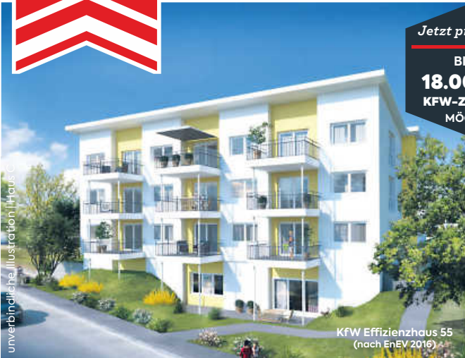
KfW Effizienzhaus 55 (nach EnEV 2016)

DIESEN SONNTAG, 29.11.2020 VON 14-16 UHR